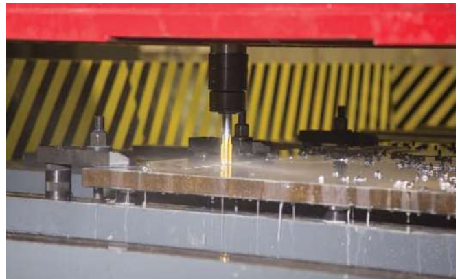
Tapping Diş Çekme